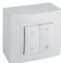
REGUL 2 rozměry (Š x V x H) 80 x 80 x 45 mm