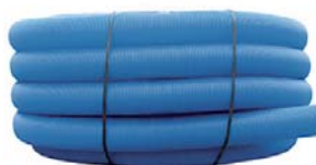
ED Geoflex® 200/175