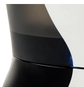
indikace úrovně naplnění vodní nádrže